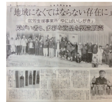
八重山毎日新聞(2016年1月)